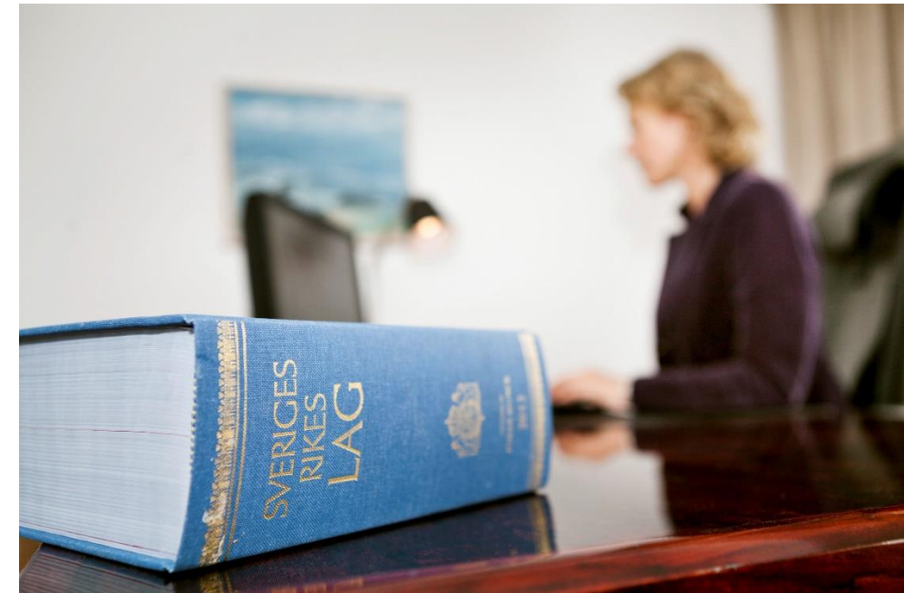
Scandinav: Astrakan images